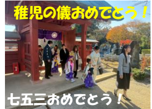
七五三おめでとう！