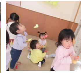
落ち葉や木の実で遊んだよ