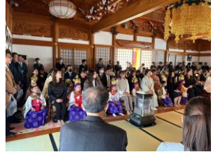
七五三おめでとう！