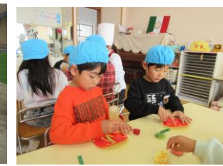
おいしいピザを作ろう