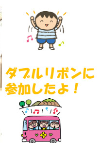
ダフルリボンに参加したよ！