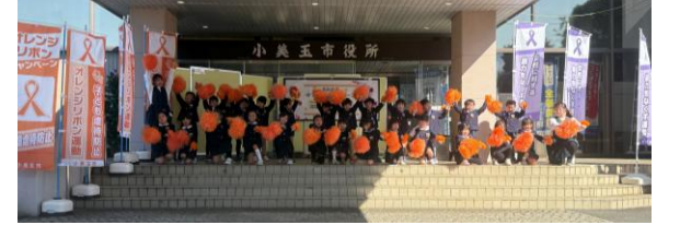
ダフルリボンに参加したよ！