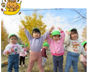
お外遊び楽しいね！