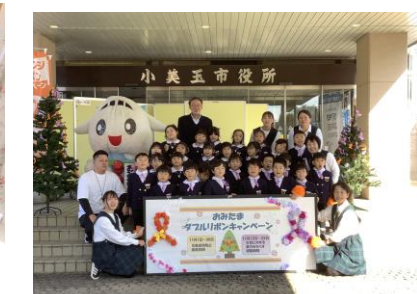
ダフルリボンに参加したよ！