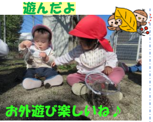
お外遊び楽しいね！