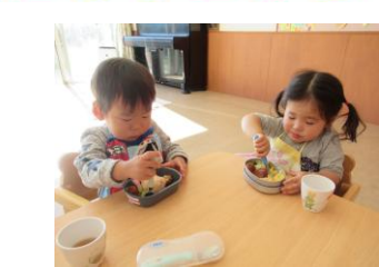
お弁当 うれしいな