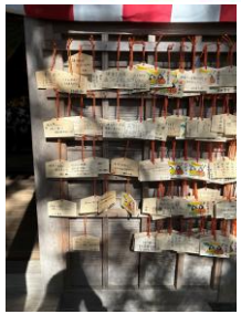
七五三おめでとう！