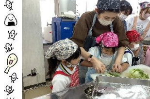
猫の手で押さえて