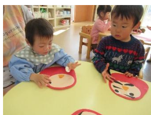
どこに貼ろうかな