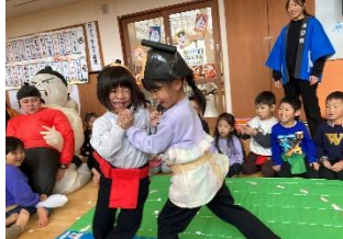
お相撲 負けないぞ～