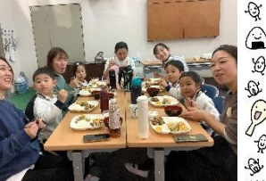
みんなで食べると美味しい