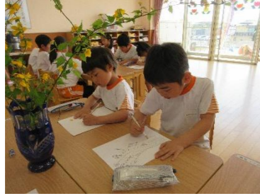
～テッサン～ やまぶきを描いたよ