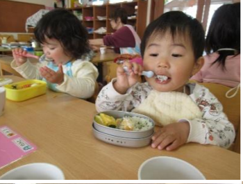
お弁当 嬉しいなあ～