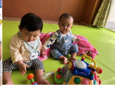
保育園に慣れたよ!