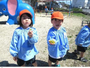
たんぽぽ見つけたよ