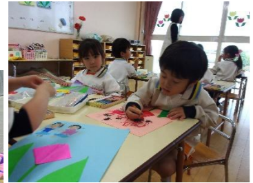
～折り紙制作～ チューリップが出来たよ