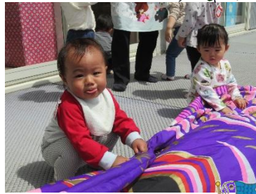
こいのぼりと たくさん遊んだよ!