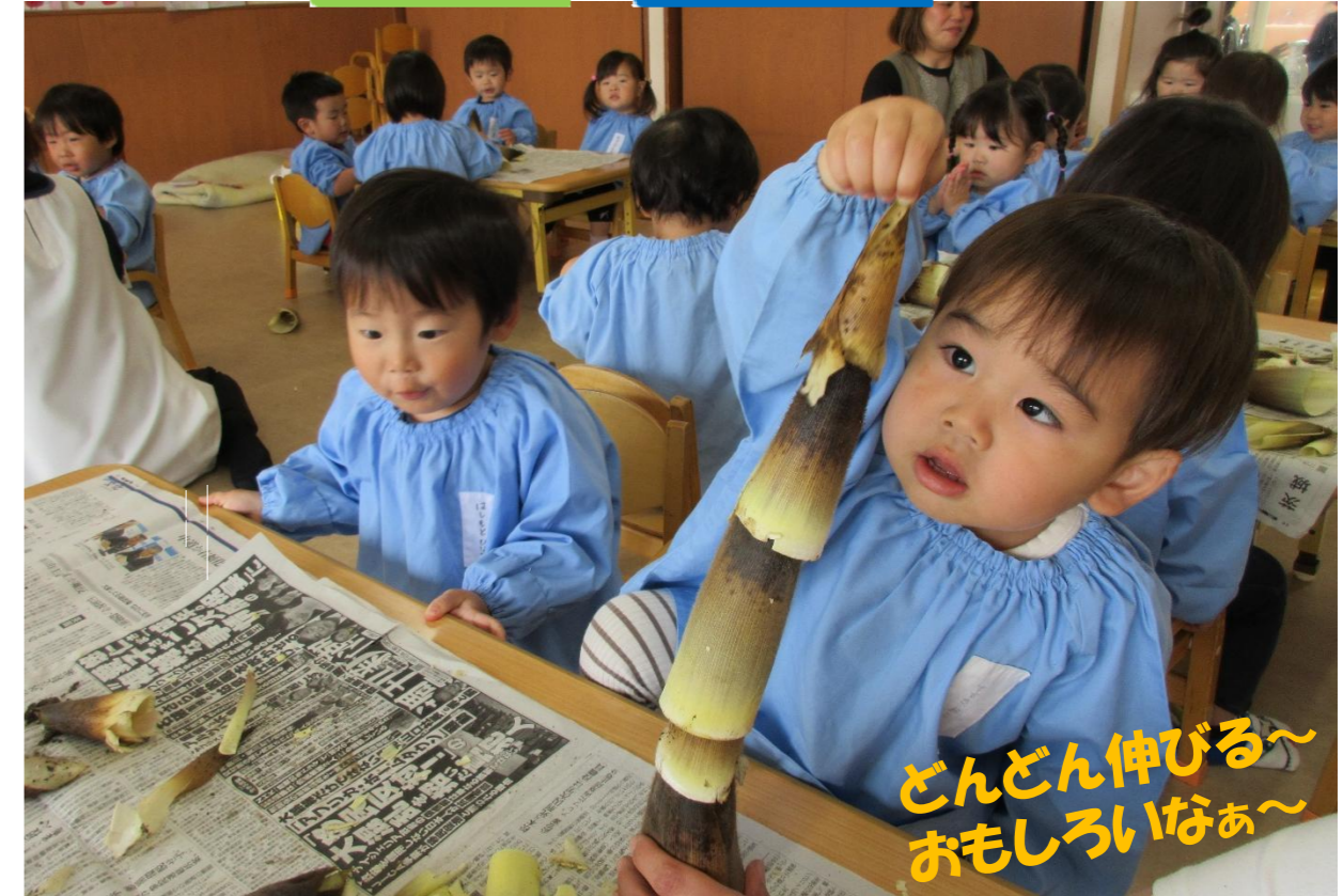
どんどん伸びる〜 おもしろいなあ〜

さわやかな風が吹く中で、暖かな日差しが気持ちいい季節です。こいのぼりを見上げるかわいらしい笑顔が並び、みんなで春を感じています。入園・進級から1か月が経ち、笑顔で挨拶をしたり、先生を呼んでお話ししたりする様子が少しずつ見られるようになりました。子ども達一人ひとりのペースを大切にしながら、今月も楽しく過ごしていきたいと思ひます。