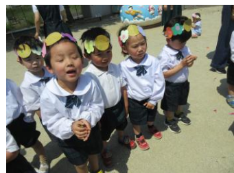
みんなでお遊戯したよ!