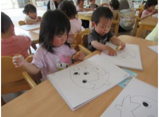
シール貼り上手だよ!