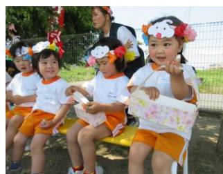
お花でお祝いしたよ♪