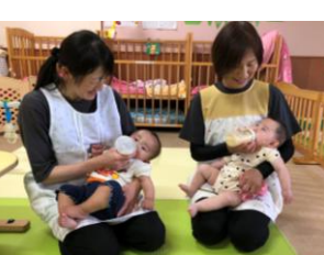
ゴクゴク美味しいね♪