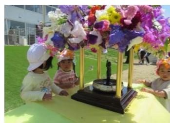
灌仏! 甘茶をかけて