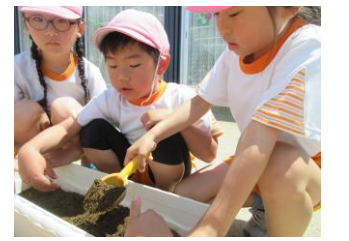
早く大きくなってね!