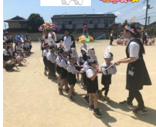
ソウさんを引いたよ